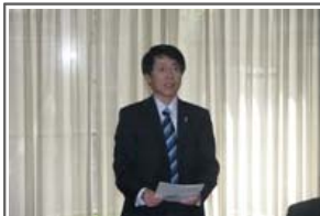
挨拶 谷江幸雄学長