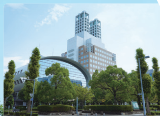
ソフトピアジャパン

約150社の大手企業やベンチャー企業が入るソフトピアジャパン。この一大IT拠点で研究開発に取り組めます。企業の方とコミュニケーションをとりながらプロジェクトを進行し、その成果は情報処理学会で発表。大学の講義では得られない貴重なキャリア形成の機会です。