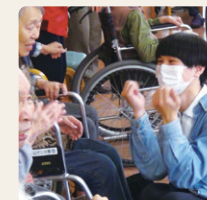
医療ボランティア論